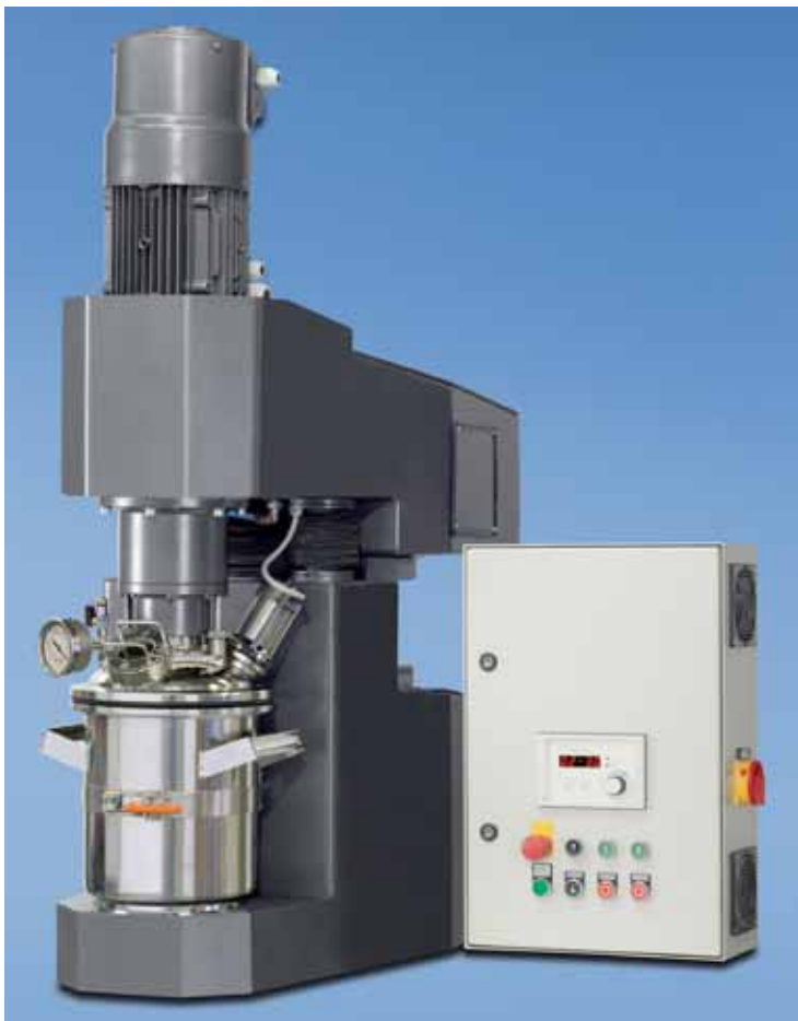
Baureihe DLD mit 1,1 kW Dissolver Randabstreifer, Behälter 3 Liter

alle ausrüstbar z.B. mit Randabstreifer, Planetenmischarmen, Butterflyrührorganen und Dispergierscheiben