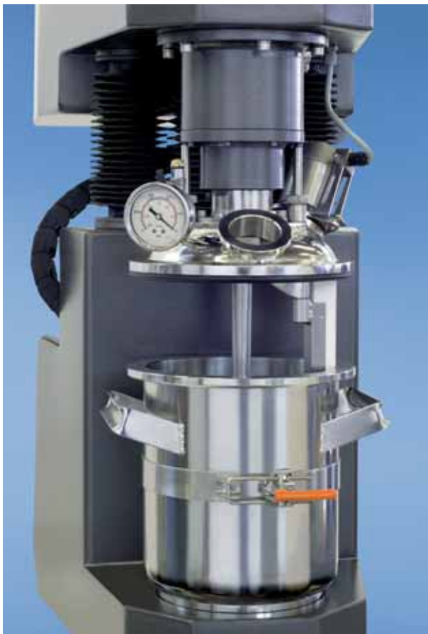
Details DLD Dissolver/Abstreifer